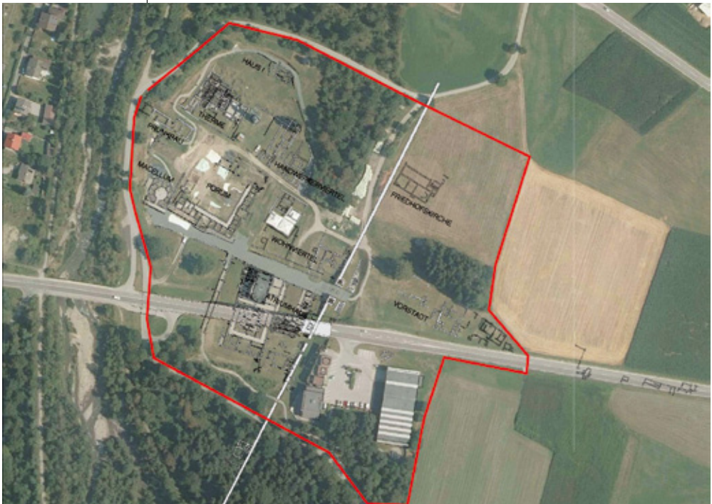
Abb. 1: Untersuchungs- gebiet (Grenzen in Rot) und „Stadt- plan“ von Aguntum auf einem aktuellen Orthofoto mit Bezeichnung der einzelnen Stadt- teile.

Das für die gegenständlichen Erhebungen abgegrenzte, rund 7,5 ha große Untersuchungsgebiet ist in Abb. 1 dargestellt und umfasst das gesamte heutige, ganzjährig frei betretbare Ausgrabungsareal von Aguntum mit rund 3 ha sowie einen Randbereich aus verschiedenen Gehölzstrukturen und das Areal des dortigen Gebäudekomplexes (Museum, Parkplatz, Bürogebäude etc.; Abb. 2). Im Hinblick auf die in diesem Gebiet vorkommenden Biotoptypen wird auf Kap. 4.1 verwiesen. Im Lageplan von Aguntum (Abb. 1) sind die tw. in dieser Studie erwähnten Stadtteile beschriftet. Eine markante Zäsur stellt die Querung der heutigen B100 im südlichen Teil von Aguntum dar.