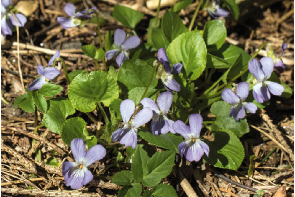
Abb. 7: Das auch in Botani- kerkreisen wenig bekannte Pyrenäen- Veilchen ( Viola pyrenaica ) kommt in Aguntum an vier Stellen vor.