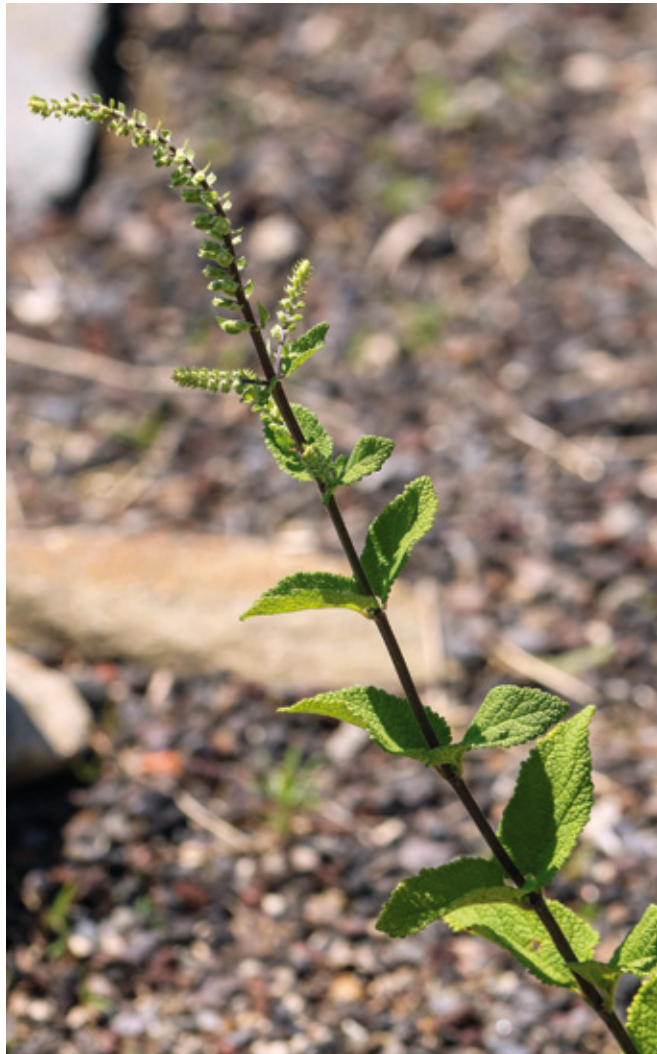
Abb. 6: Einzelindividuum des Salbei-Gaman- ders ( Teucrium scorodonia ) im Marcellum Agun- tums – ein Neufund für Osttirol.

Diese sehr zarte und unscheinbare Wicke ist in der Roten Liste Österreichs für die westlichen Alpentale und damit auch für Osttirol als gefährdet eingestuft. Tatsächlich kommt Vicia tetrasperma im Vergleich zur ähnlichen Vicia hirsuta im Bezirk Osttirol deutlich seltener und stets individuenarm vor (STÖHR ined.), sodass diese Gefährdungseinstufung nachvollzogen werden kann. In Aguntum tritt die Art in trockenen Ruderalfluren im zentralen Ausgrabungsbereich auf.