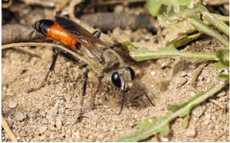
Abb. 9: Die auffallende Heuschrecken- Sandwespe wurde von O. Stöhr im Sommer 2019 in Aguntum nachge- wiesen, vermutlich ein Neufund für Osttirol.

canorus ), Buntspecht ( Dendrocopos major ), Hausrotschwanz ( Phoenicurus ochruros ), Kohlmeise ( Parus major ), Tannenmeise ( Parus ater ), Blaumeise ( Cyanistes caeruleus ), Amsel ( Turdus merula ), Buchfink ( Fringilla coelebs ), Goldammer ( Emberiza citrinella ), Stieglitz ( Carduelis carduelis ), Eichelhäher ( Garrulus glandarius ). Zweifelsfrei sind weitere Arten zu erwarten.