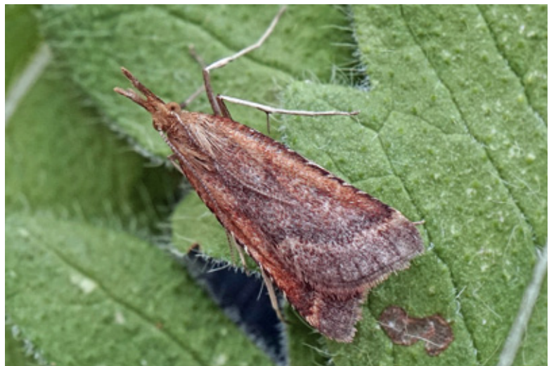
Abb. 8: Der Fund des Zünslers Synaphe punctalis vom 30. Juli 2019 war der Zweitnachweis für Osttirol. Foto: H. Deutsch 2019

Es konnte eine Anzahl von wärmeliebenden Arten festgestellt werden, die zu den Habitats Trockenwiese und Magerrasen passen, jedoch keine herausragenden Spezialisten sind. Einige Arten waren zufällig im Areal oder wurden von den Leuchtlampen aus den umliegenden Wald-