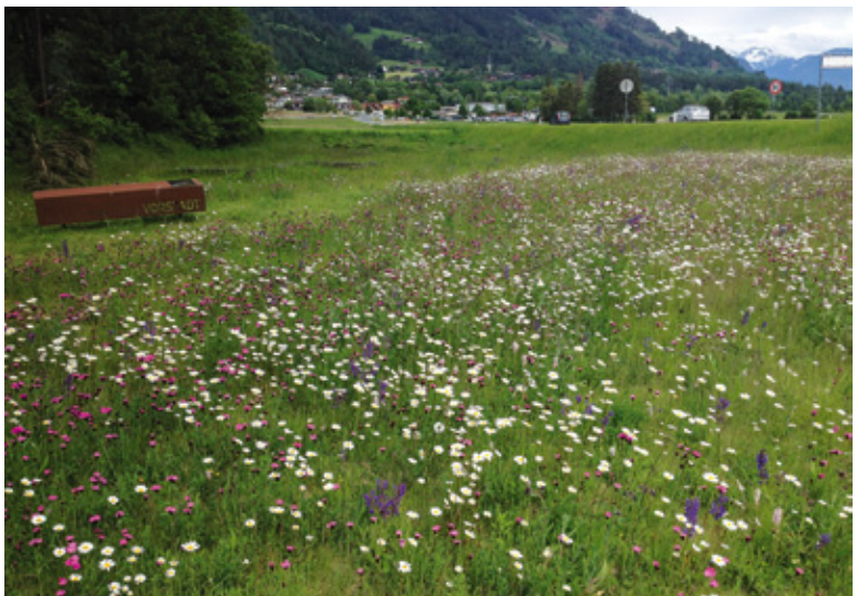
Abb. 10: Aguntum blüht: Bunte Trocken- wiesenaspekte im Mai 2019 (erster Aufwuchs) im „Handwerker- viertel“ (oben) und in der „Vor- stadt“ (unten); Fotos: O. Stöhr 2019.